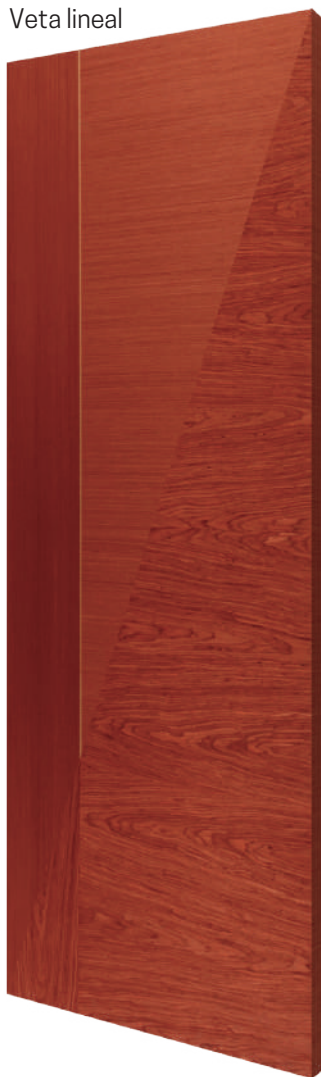
Veta corona Foto referencial